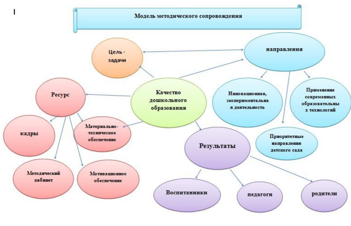
Рисунок 3. Модель методического сопровождения детского сада №179 «Подснежник»

Система методической работы в детском саду обеспечивает непрерывное профессиональное развитие педагогов, а, следовательно, стимулирует оптимизацию в образовательной системе детского сада форм, технологий, методов и средств обучения, их целесообразный выбор и оптимальное сочетание для детей дошкольного возраста. (Рисунок 3).