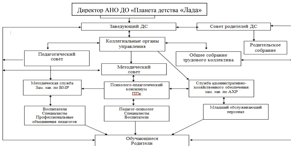
Рисунок 1. Система управления детского сада № 179 «Подснежник»

Управление детским садом строится на принципах единоначалия и коллегиальности. Компетенция органов управления определена согласно Уставу АНО и функциональным задачам детского сада. Модель системы управления детского сада представлена на рисунке 1.